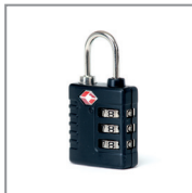
HPRCLO PADLOCK - TSA