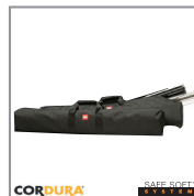
HPRCCB5400W CORDURA BAG